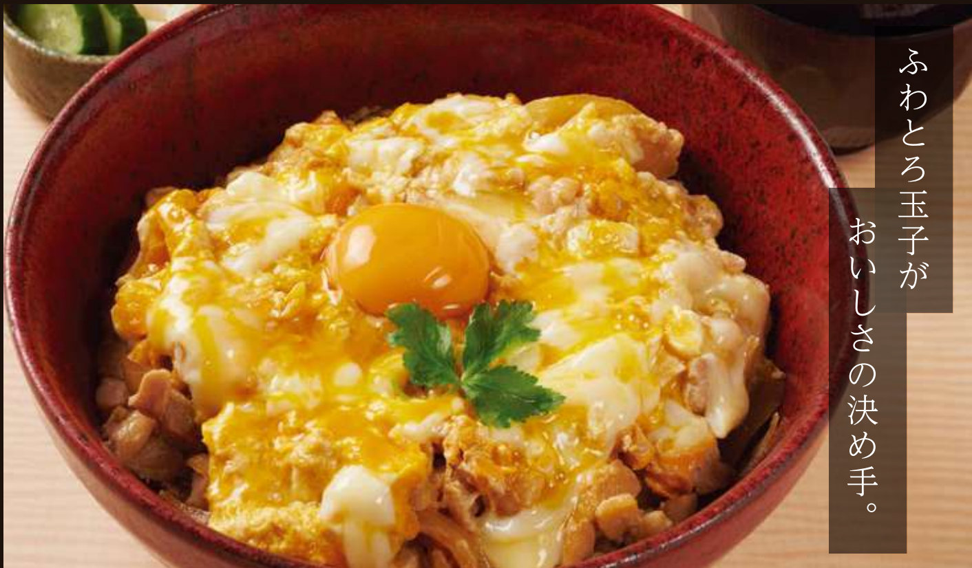
親子丼 Chicken with Egg Rice Bowl