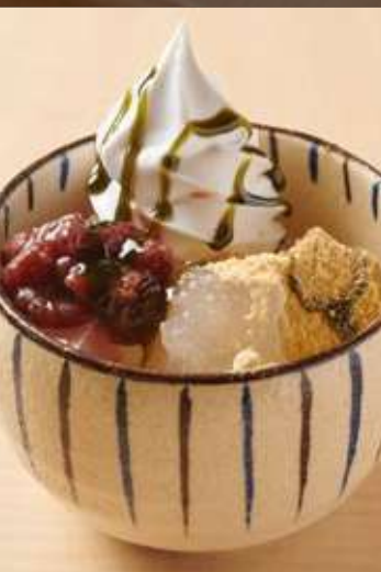
わらび餅パフェ 抹茶きな粉

Warabi Mochi Parfait with Milk Soft-serve, Adzuki bean, Kinako, Brown Sugar Sauce