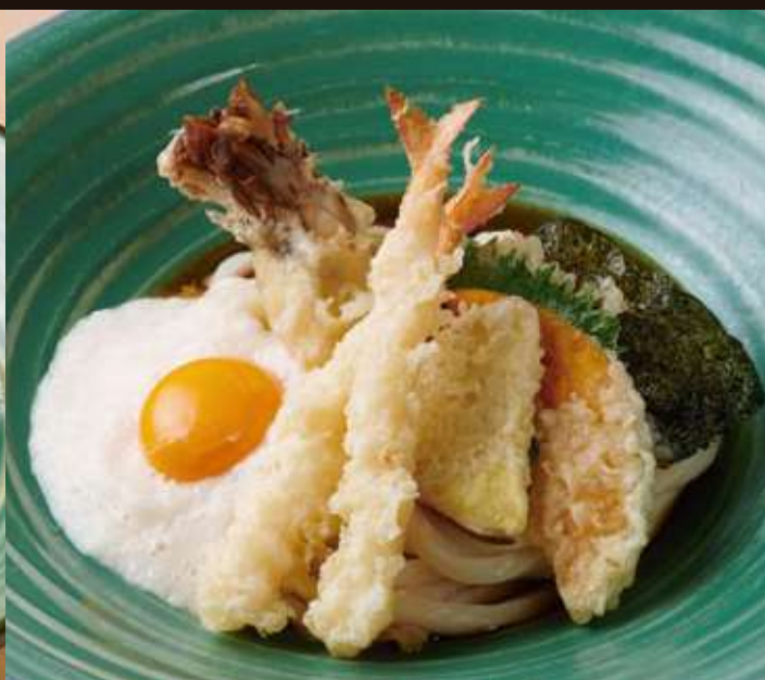
天山かけのおうどん