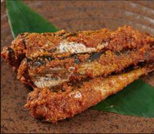
明太いわし Mentaiko-stuffed Sardines