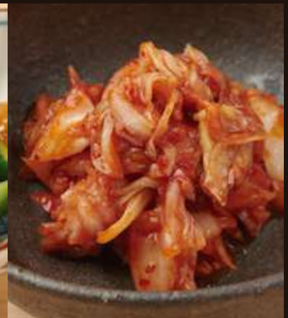
白菜キムチ Chinese Cabbage kimchi