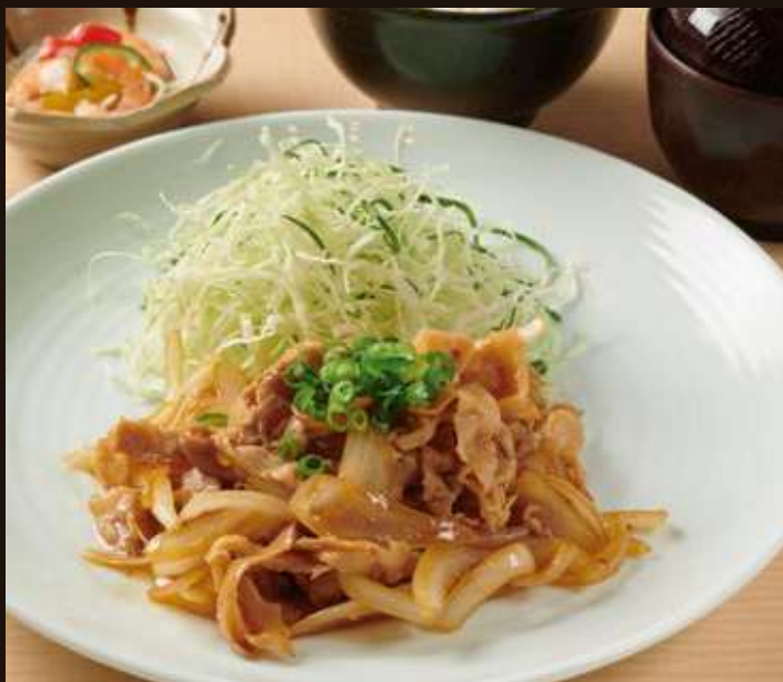
生姜焼き定食 Ginger Pork Set