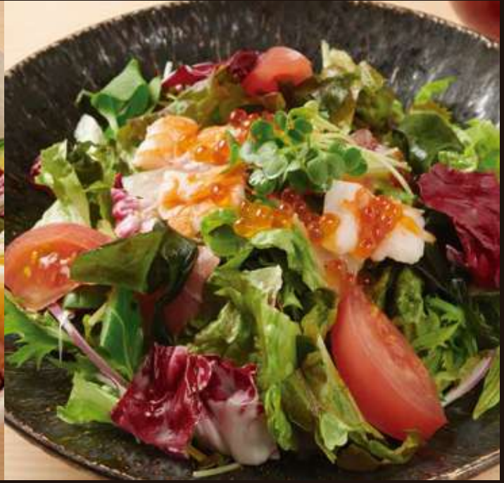
海鮮サラダ ¥1,300 Seafood Salad