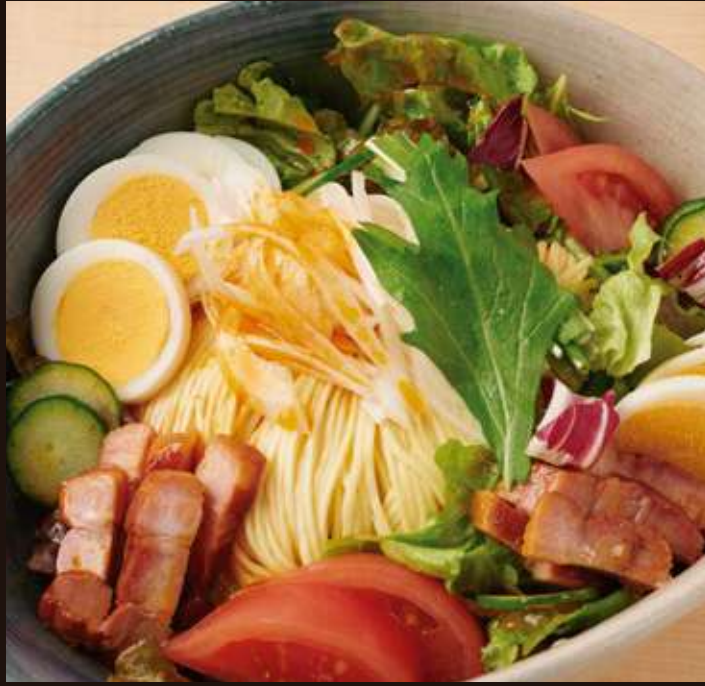
ラーメンサラダ ¥1,000 Chilled Ramen Salad with Chinese Style Dressing