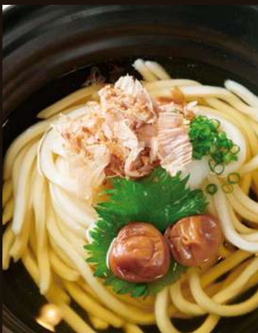
梅干しのおうどん ¥950 Pickled Plum Udon