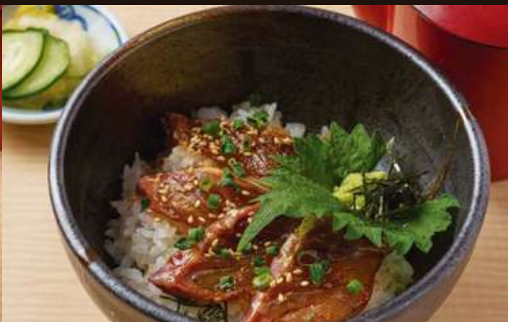
鯛だし茶漬け ¥950 Soup Stock over Rice, Sea Bream