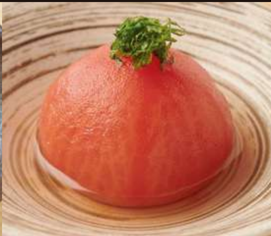
トマトの浅漬 Pickled Tomato