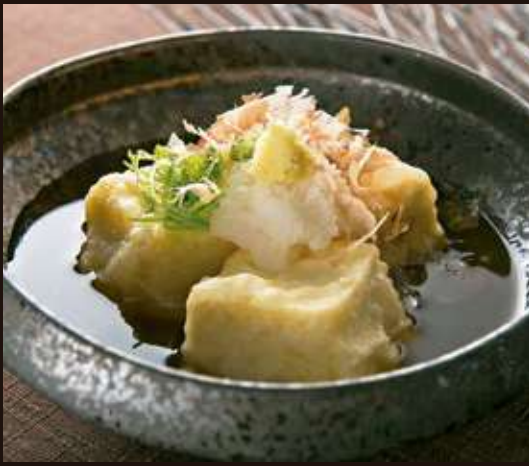
揚げだし豆腐 Fried Tofu in Soup Stock