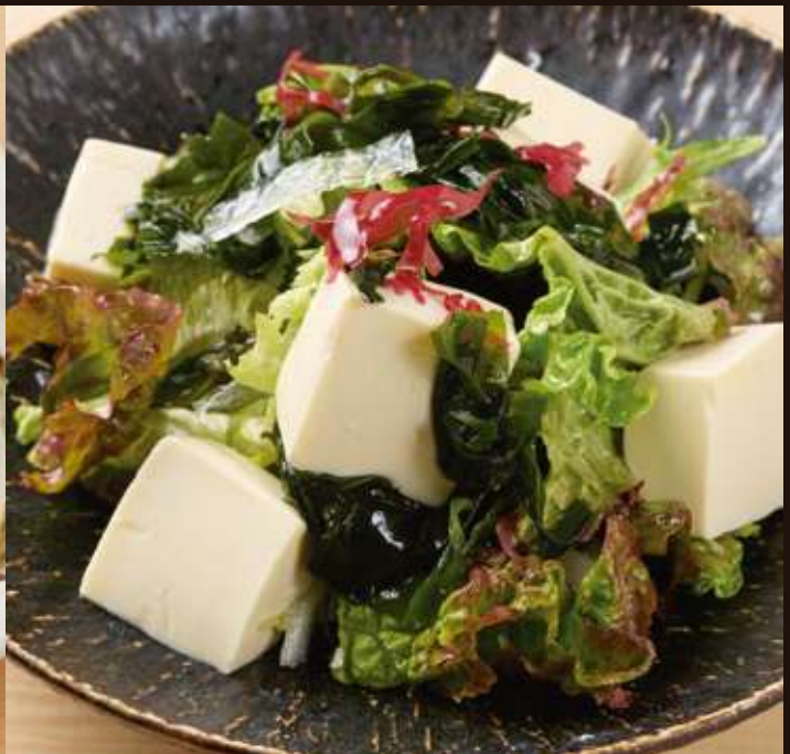
海藻と豆腐のサラダ ¥880 Seaweed and Tofu Salad