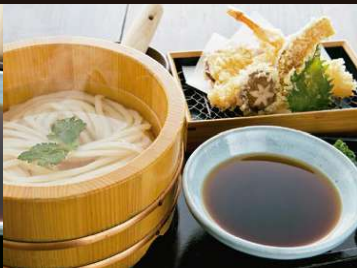
天釜揚げのおうどん Kama-age Udon with Tempura