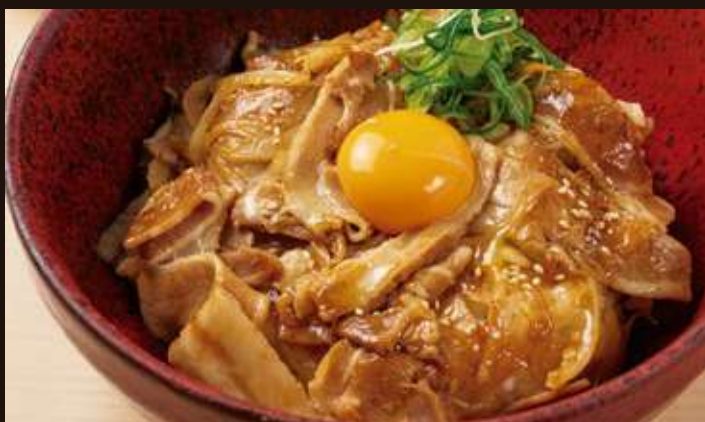
豚スタミナ丼 ¥1,100 Grilled Pork with Garlic Soy Sauce Rice Bowl