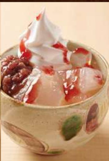
わらび餅パフェ いちご小豆

Warabi Mochi Parfait with Milk Soft-serve, Adzuki bean, Walnut, Caramel Sauce