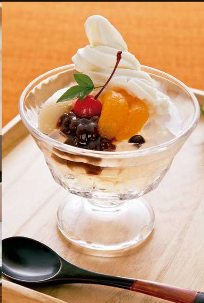
クリームあんみつ