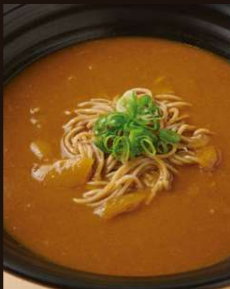
カレーのおそば ¥980 Beef Curry Soba