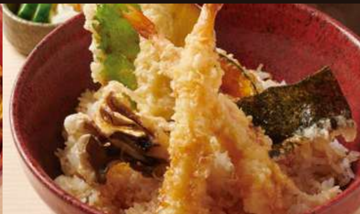
天丼 ¥1,280 Tempura Rice Bowl