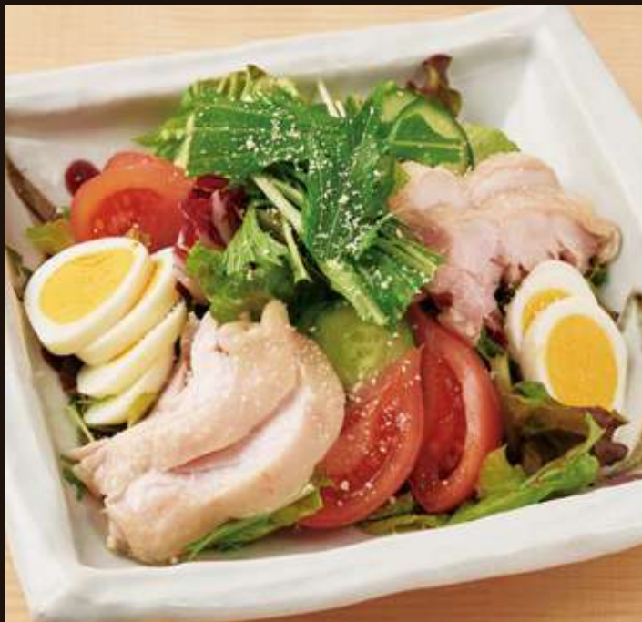
蒸し鶏のシーザーサラダ ¥900 Steamed Chicken Salad