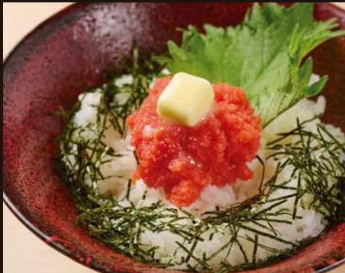
明太子バターご飯 Mentaiko with Butter Rice