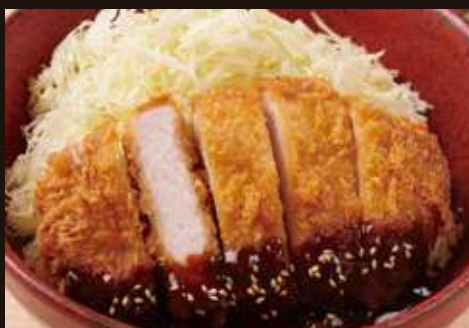
味噌カツ丼 ¥1,380 Pork Cutlet with Sweet Miso Sauce and Cabbage Rice Bowl