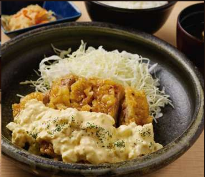
チキン南蛮定食 Fried Chicken with Sweet Sauce Set