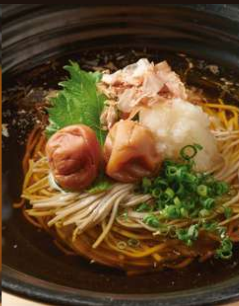
梅干しのおそば ¥950 Pickled Plum Soba