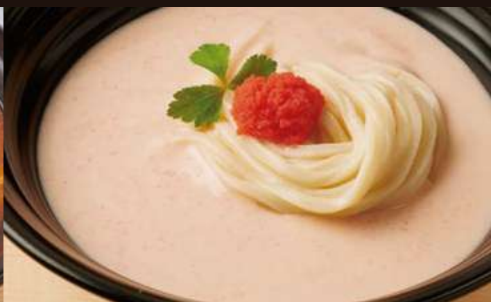
明太子クリームのおうどん Udon with Cream Sauce, Mentaiko