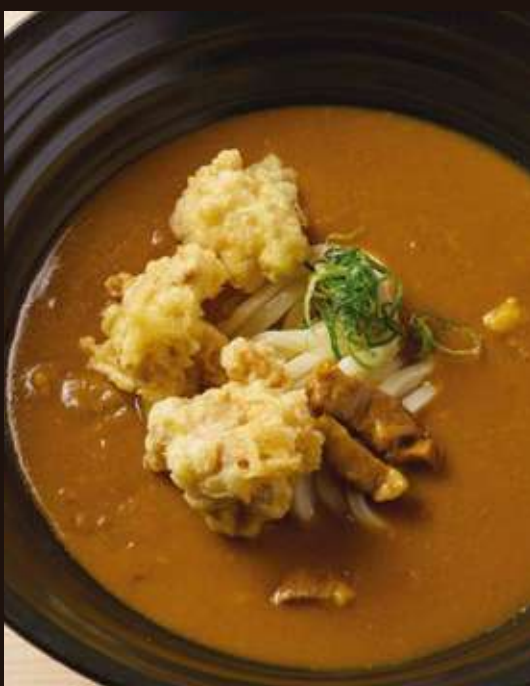
鶏天カレーの おうどん ¥1,350 Beef Curry Udon with Chicken Tempura