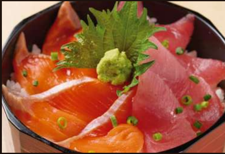
まぐろサーモンおひつごはん ¥1,580 Seafood Bowl/Salmon, Tuna