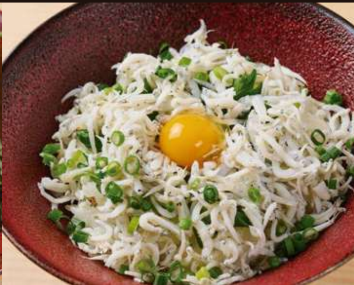
しらすご飯 Whitebait and Grated Radish Rice