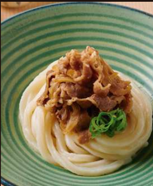
牛肉ぶっかけの おうどん ¥1,380 Chilled Beef Udon