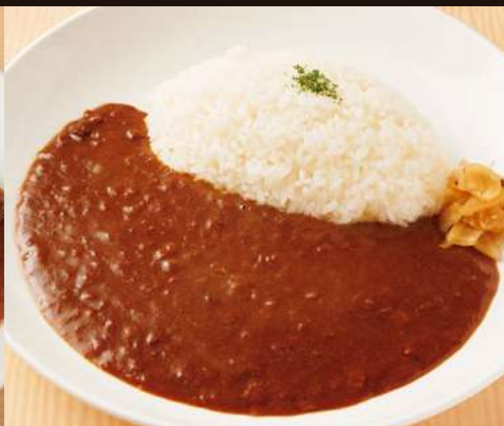
カレー Beef Curry Rice