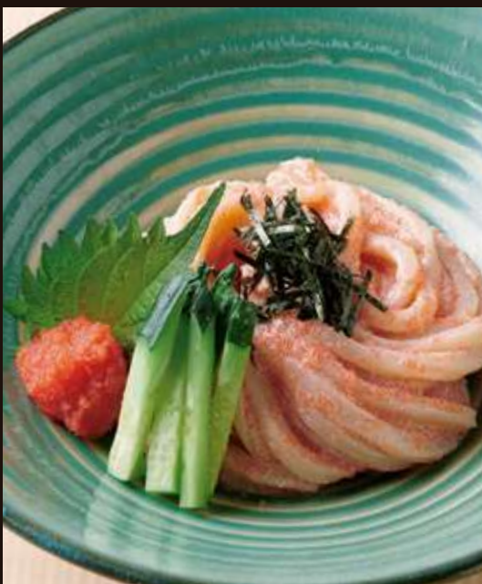
明太子のおうどん ¥1,000 Chilled Udon Noodles with Mentaiko Sauce