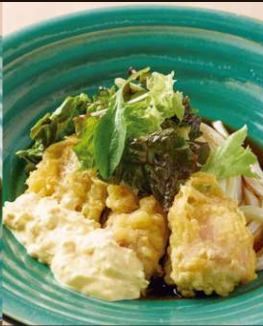
タルタルかけ鶏天の おうどん ¥1,300 Chilled Chicken Tempura Udon Topped with Tartar