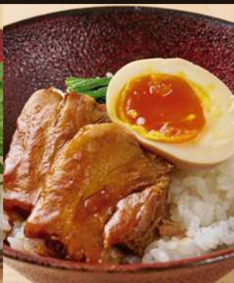
角煮ご飯 Braised Pork Rice