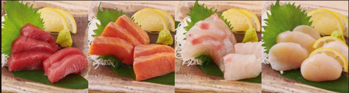
マグロ ¥850 Tuna Sashimi サーモン ¥850 Salmon Sashimi 鯛 ¥850 Sea Bream Sashim ホタテ ¥850 Scallop Sashimi