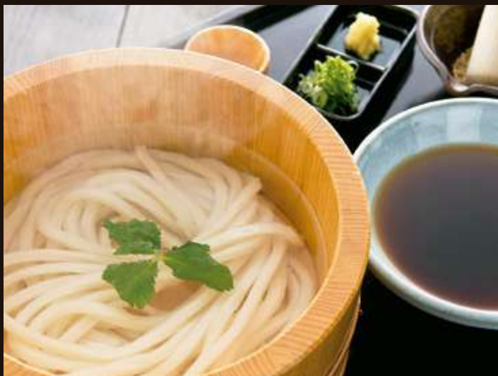
釜揚げのうどん Kama-age Udon