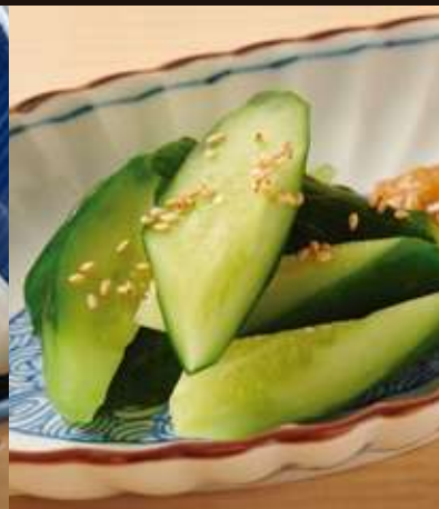
やみつき胡瓜 Cucumber Slices with Miso Dressing