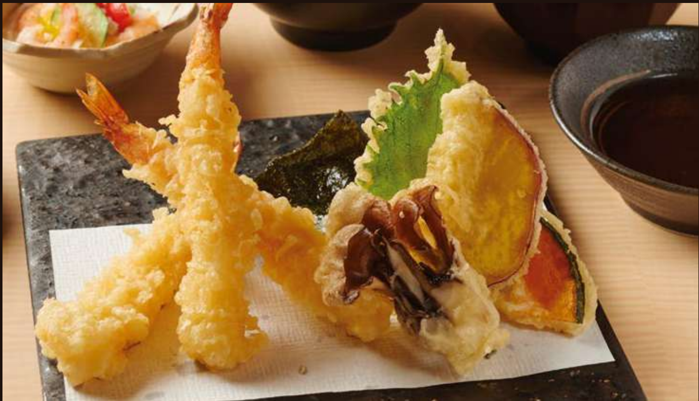
天ぷら盛り合わせ Tempura