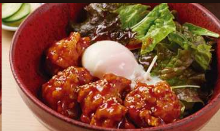
ピリ辛唐揚げ丼 ¥1,200 Spicy fried chicken Rice Bowl