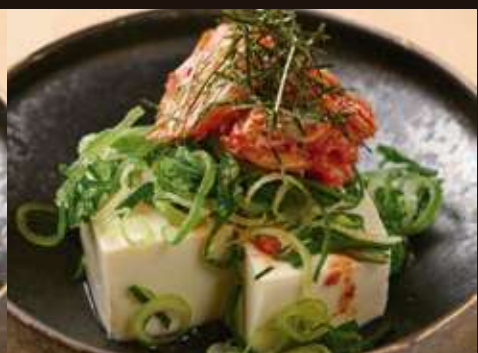
ピリ辛キムチやっこ