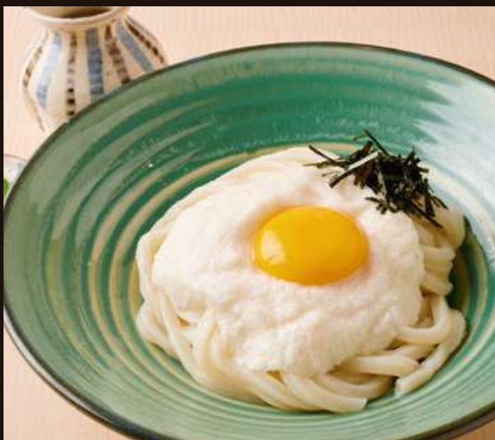
山かけのおうどん

Chilled Udon Noodles with Tempura, Grated Radish