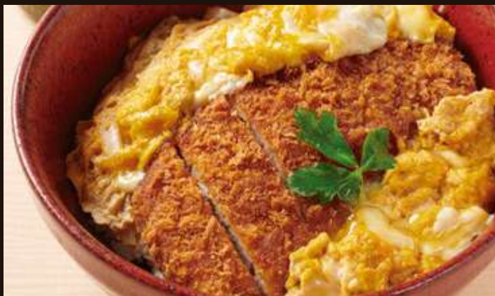
カツ丼 ¥1,380 Fried Pork Cutlet with Egg Rice Bowl