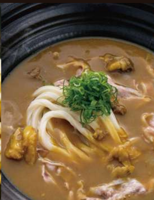
カレーのおうどん ¥980 Beef Curry Udon