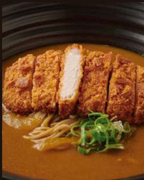
カツカレーのおそば ¥1,550 Beef Curry Soba with Fried Pork Cutlet