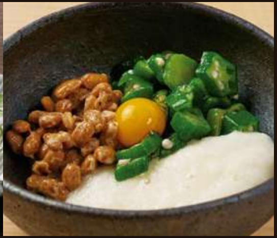
ねばねば小鉢 Tororo, Okra, Natto Bowl