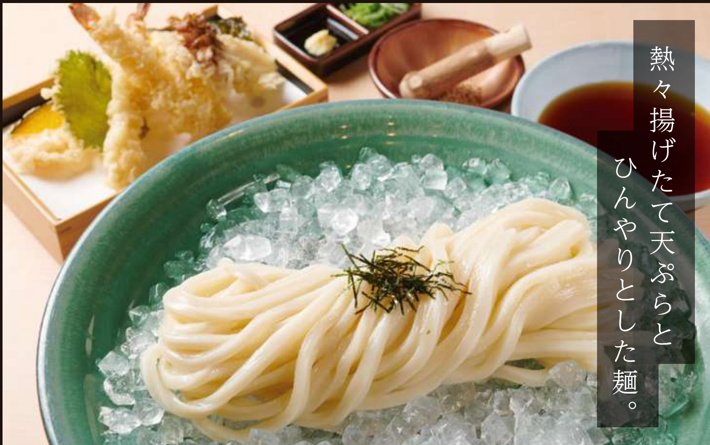
天ざるのおうどん Chilled Udon Noodles with Tempura