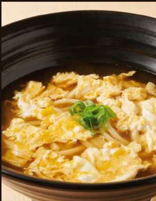
玉子とじのおうどん ¥850 Scrambled Egg Udon