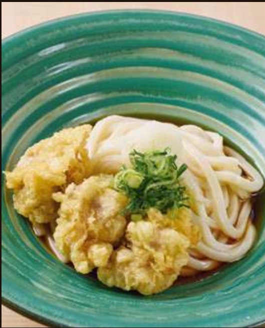
鶏天ぶっかけの おうどん ¥1,200 Chilled Chicken Tempura Udon