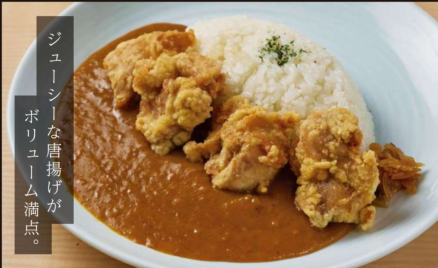
唐揚げカレー Fried Chicken Curry Rice