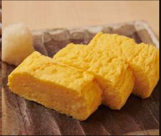
出汁巻き玉子 Japanese Omelette made with Soup Stock