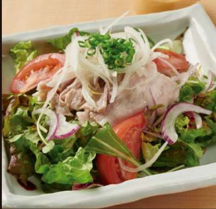
豚しゃぶサラダ ¥930 Boiled Pork Salad