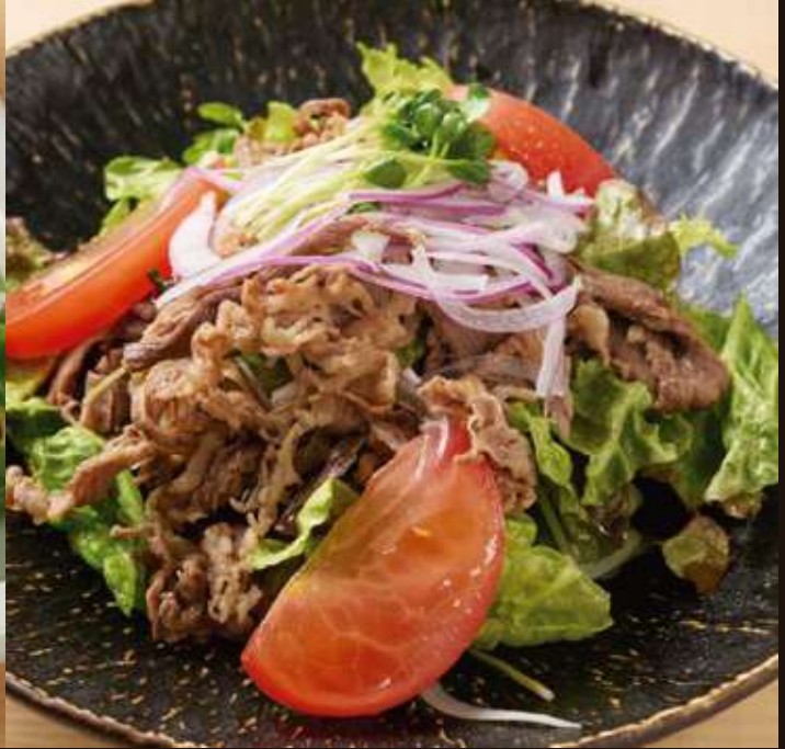
牛カルビサラダ ¥1,200 Grilled Beef Salad