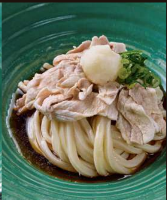
豚しゃぶおろしの おうどん ¥1,300 Chilled Udon Noodles with Boiled Pork, Grated Radish