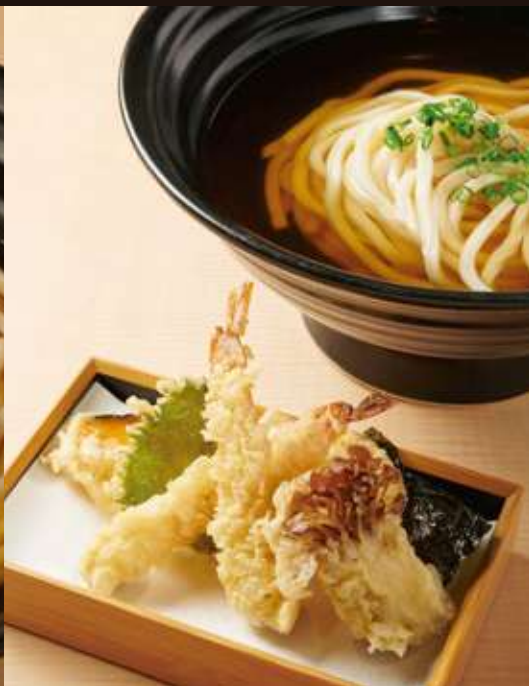
天ぷらのおうどん ¥1,380 Tempura Udon