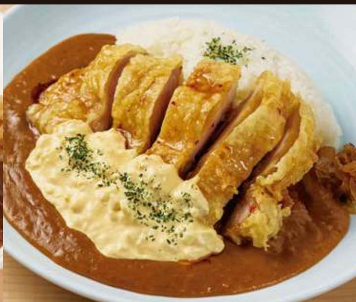
チキン南蛮カレー Fried Chicken Marinated in Sweet and Sour Sauce, Topped with Tartar Curry Rice