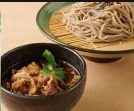
牛肉つけ汁の おそば

Chilled Soba Noodles with Tempura, Grated Radish