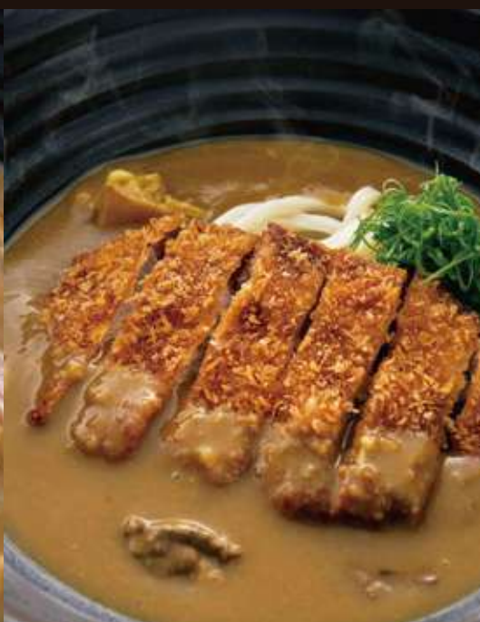
カツカレーの おうどん ¥1,550 Beef Curry Udon with Fried Pork Cutlet