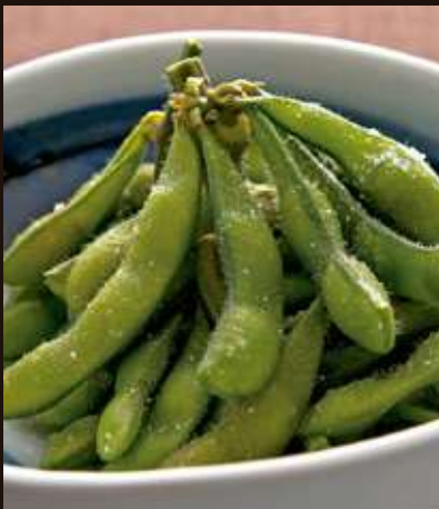
枝豆塩茹で Salted, Boiled Edamame