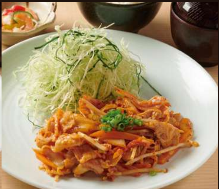
豚キムチ定食 Pork Kimchi Set