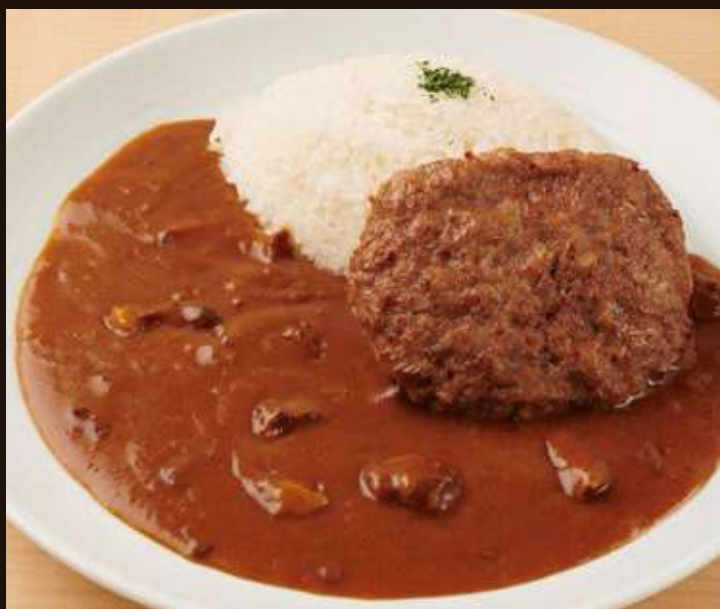
ハンバーグカレー Hamburger Steak Curry Rice