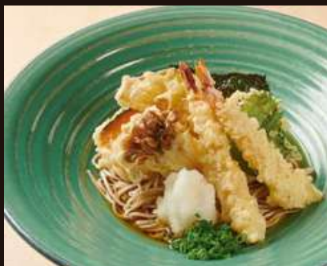
天おろしの おそば