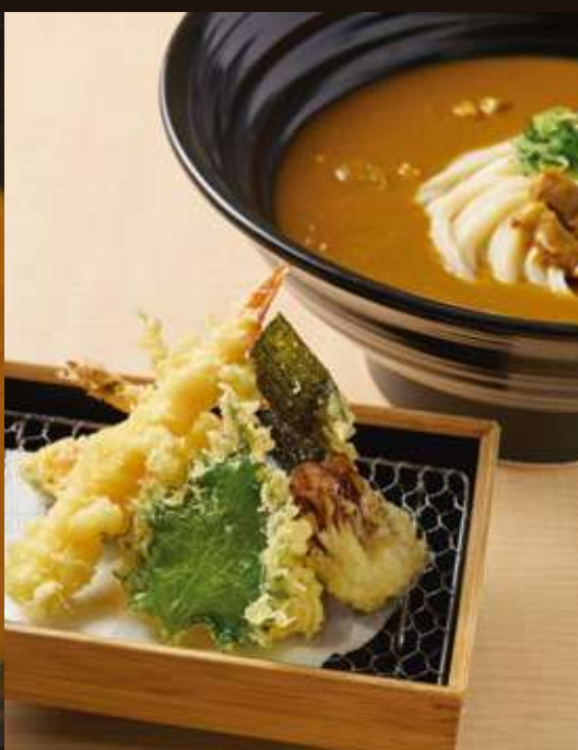
天ぷらカレーの おうどん ¥1,580 Beef Curry Udon with Tempura