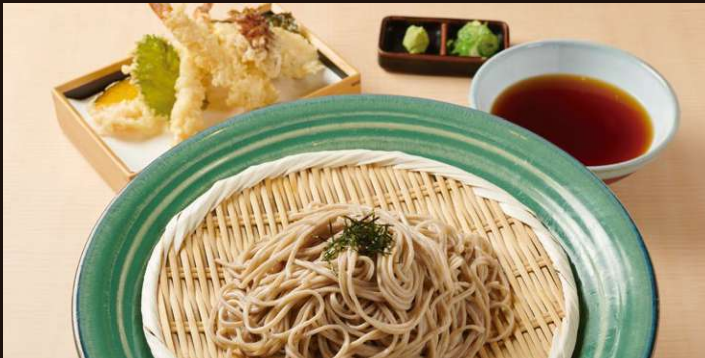
天ざるのおそば Chilled Soba Noodles with Tempura