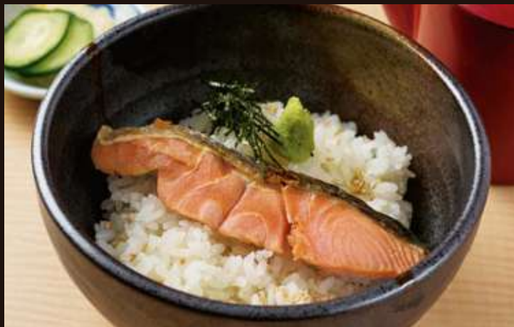
鮭茶漬け ¥850 Soup Stock over Rice, Salmon