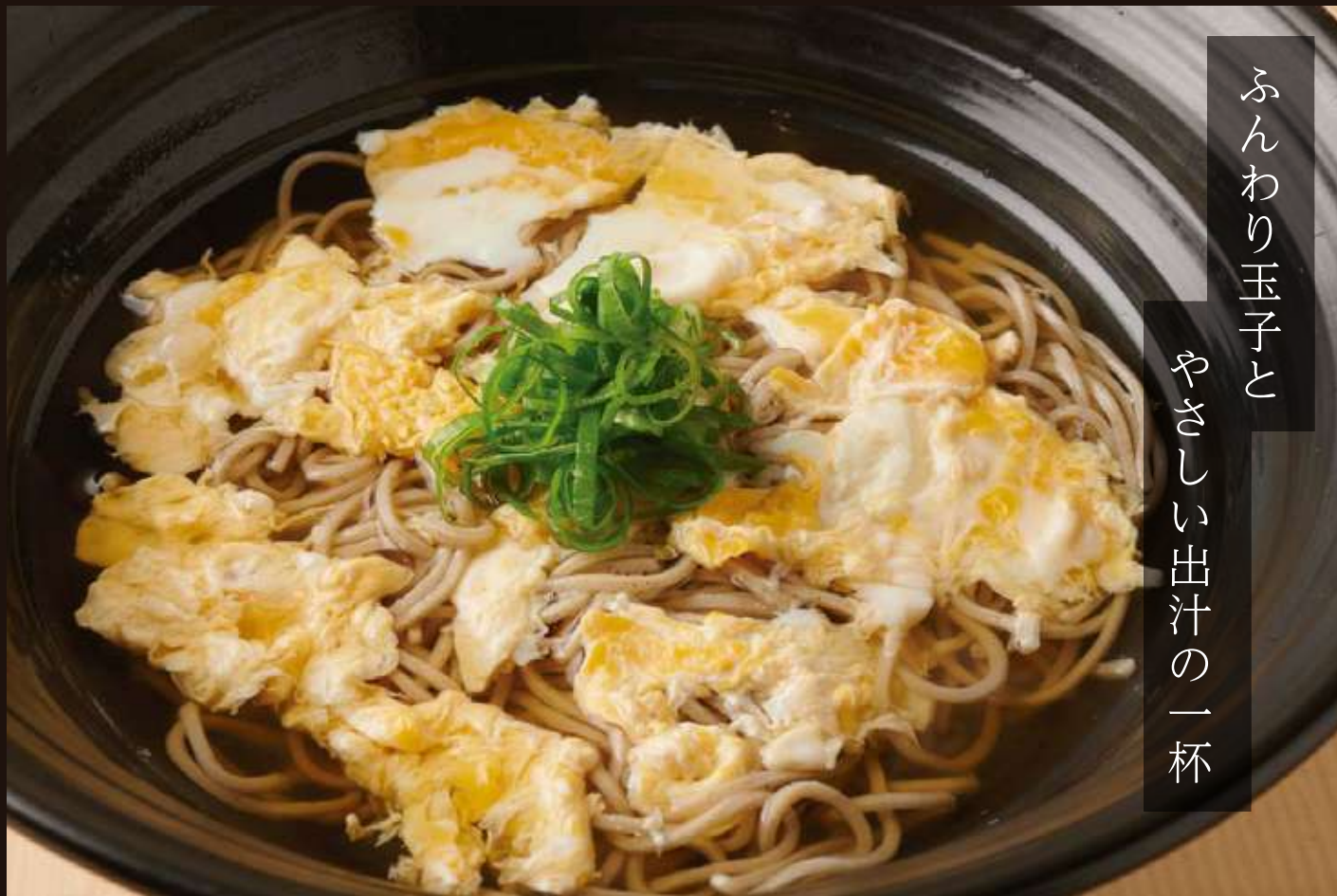
玉子とじのおそば Scrambled Egg Soba