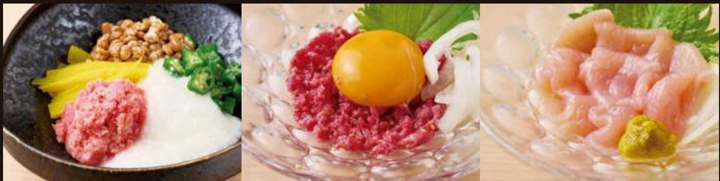
ばくだん小鉢 ¥1,000 Negi-Toro Bowl/Tororo,Okra, Natto,Pickled Radish,Tuna 牛ユッケ ¥1,200 Steak Tartare はかた 一番どりの鶏刺し ¥1,000 Chicken Sashimi