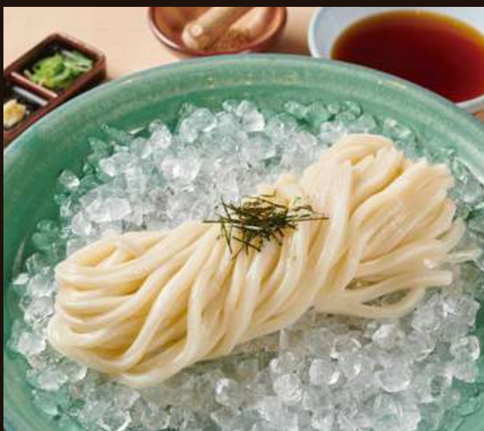
ざるのおうどん Chilled Udon