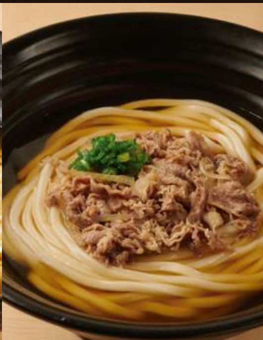
牛肉のおうどん ¥1,380 Beef Udon