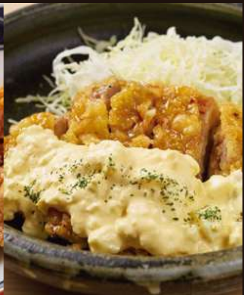
チキン南蛮タルタルソース ¥900

Deep-Fried Chicken Skin, Grated Radish, and Ponzu Sauce