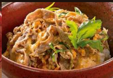
牛とじ丼 ¥1,380 Beef and Egg Rice Bowl

ご飯 大盛り extra-large serving of Rice +¥110