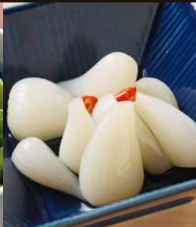
らっきょ Pickled Scallion