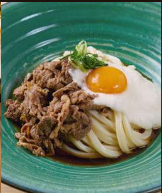
牛肉とろろの おうどん ¥1,480 Chilled Beef Udon with Japanese Yam