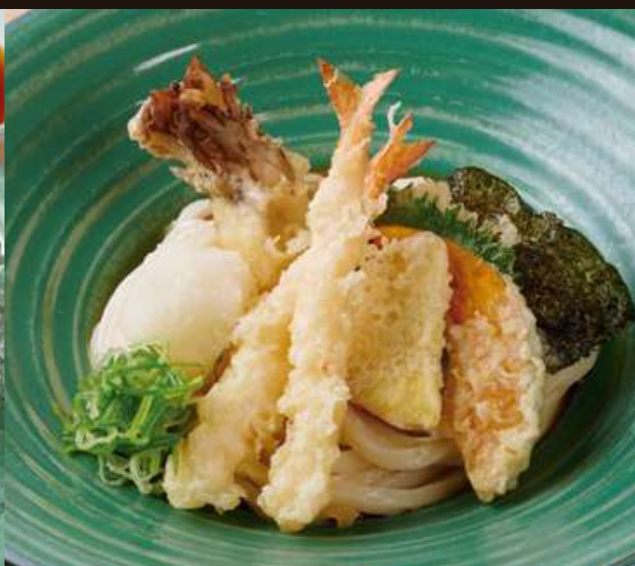
天おろしのおうどん