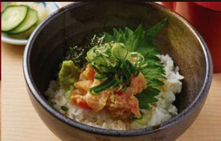
鮮魚なめろう茶漬け ¥850 Soup Stock over Rice, Fish Fillet with Miso