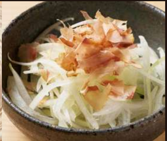
オニオンライス Sliced Onion Salad