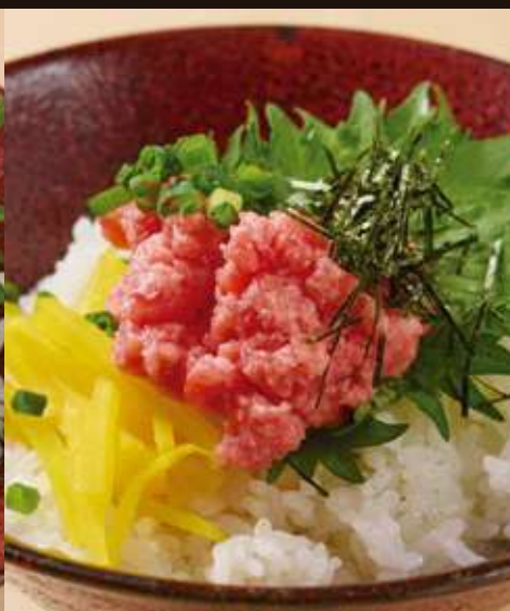
トロたくご飯 Tuna and Pickled radish Rice