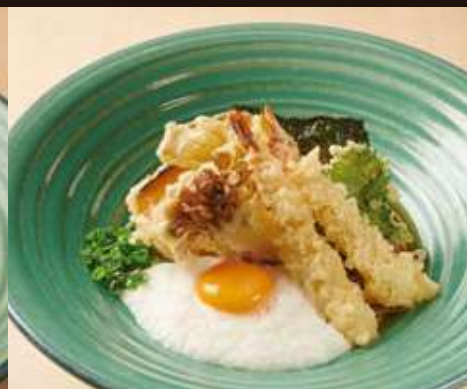
天山かけのおそば