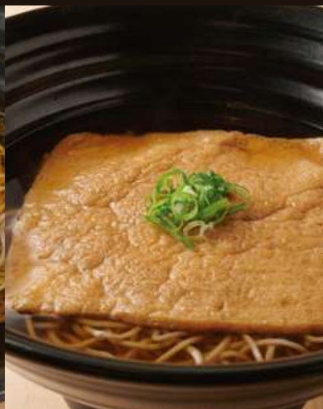
きつねのおそば ¥900 Fried Tofu Soba