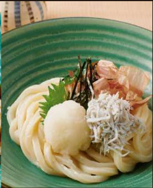
釜揚げしらすおろし ぶっかけのおうどん ¥1,100 Chilled Whitebait and Grated Radish Udon