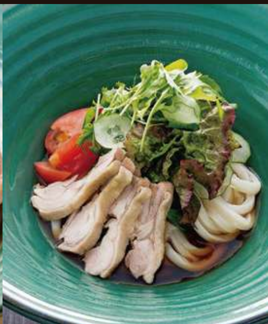
サラダのおうどん ¥1,100 Chilled Salad Udon