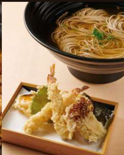
天ぷらのおそば ¥1,380 Tempura Soba