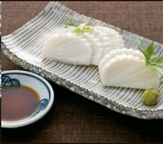
板わさび Fish Cake