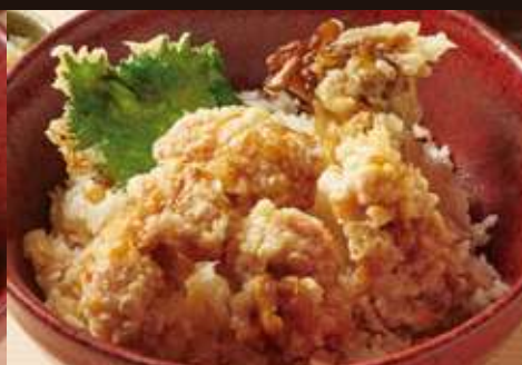
鶏天丼 ¥1,200 Chicken Tempura Rice Bowl