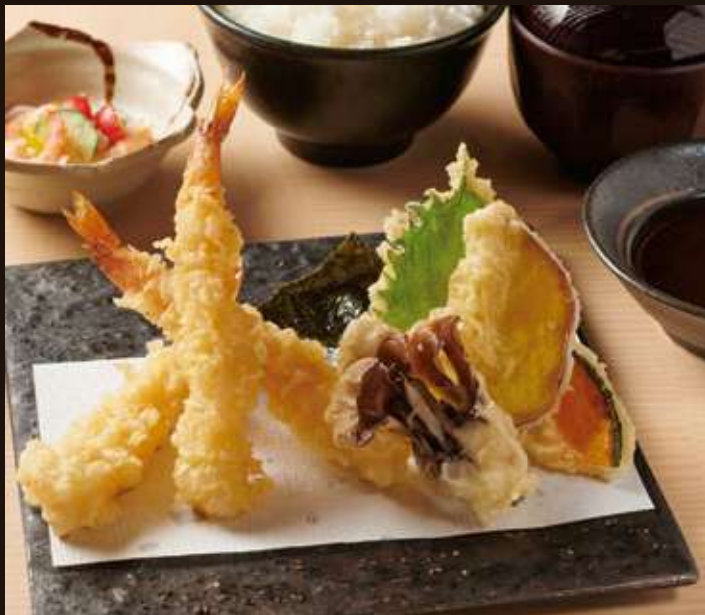
天ぷら定食 Tempura Set

定食 set menu ¥1,250 / 単品 single item ¥750