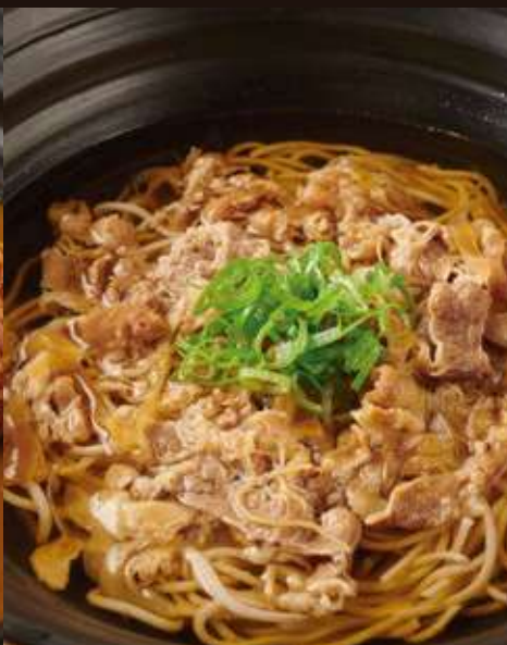
牛肉のおそば ¥1,380 Beef Soba