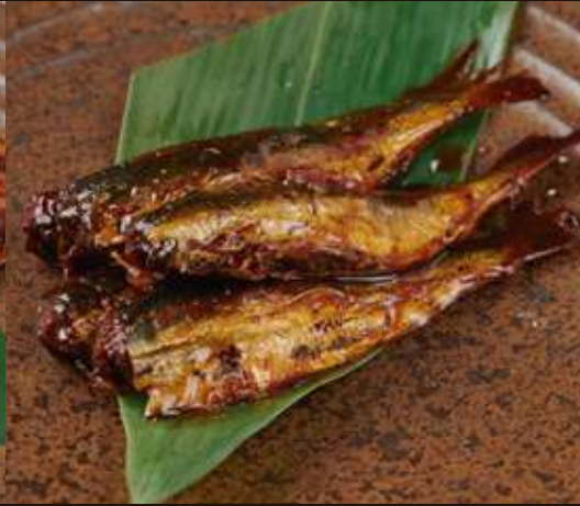
いわしの銚子煮 Simmered Sardines with Soy Sauce