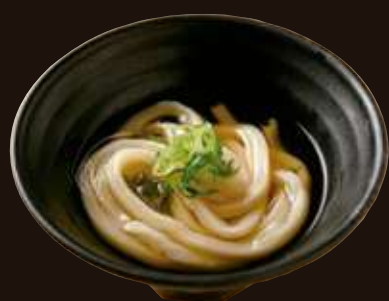
小おうどん ¥380 温または冷