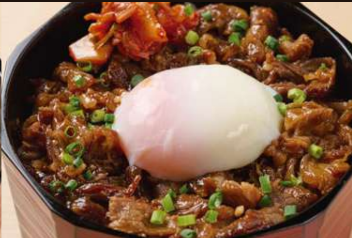
牛カルビ焼きおひつごはん ¥1,580 Beef Kalbi Rice Bowl