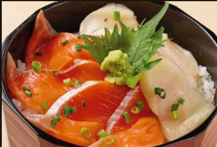
ホタテとサーモンおひつごはん ¥1,580 Seafood Bowl/Salmon, Scallops