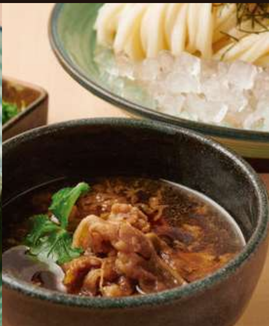
牛肉つけ汁の おうどん ¥1,380 Chilled Udon Noodles with Beef Hot Sauce