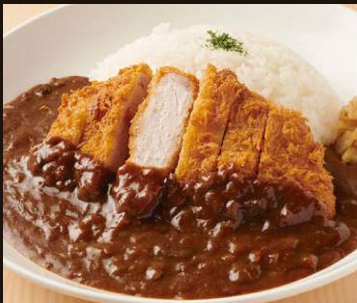
カツカレー Pork Cutlet Curry Rice