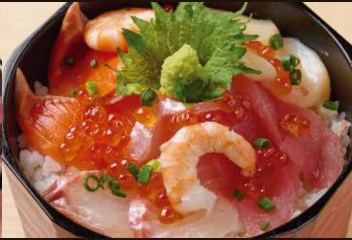
海鮮彩りおひつごはん ¥1,800 Seafood Bowl/Salmon, Tuna, Sea Bream, Boiled Shrimp