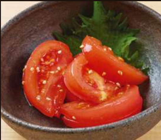
トマトの胡麻和え Tomatoes with Sesame Sauce