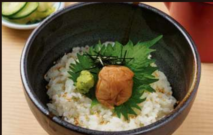
梅茶漬け ¥700 Soup Stock over Rice, Pickled Plum