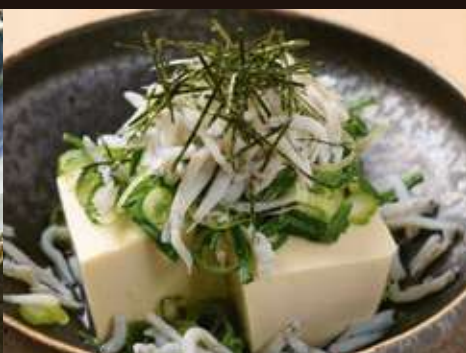
ネギしらすやっこ