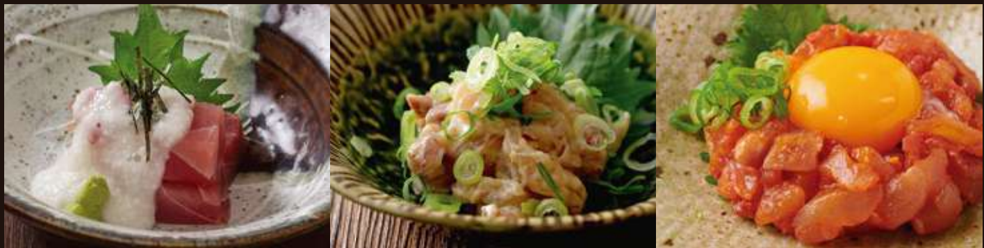
マグロ山掛け ¥800 Tuna Sashimi with Grated Yam 鮮魚のなめろう ¥750 Namero/Fresh Fish Fillet with Miso Dressing 海鮮ユッケ ¥800 Seafood Yukhoe/Spicy Fresh Fish Fillet