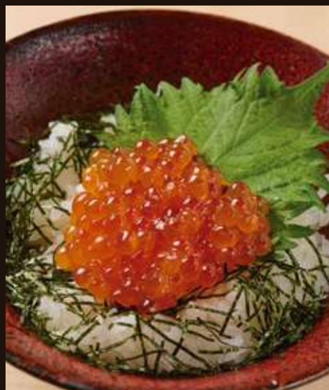
いくらご飯 Salmon Roe Rice