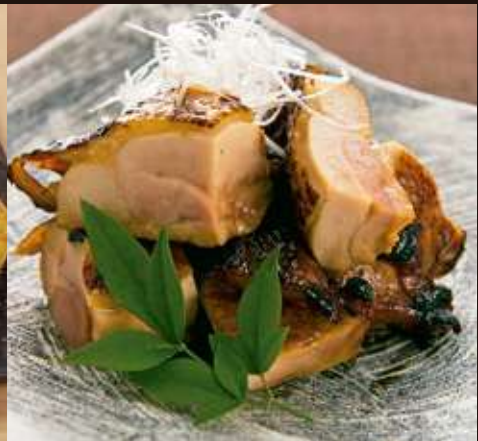
鶏もも焼き(塩・照り焼き)

Baked Chicken Thigh, Salt or Teriyaki Flavor