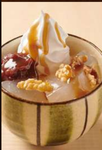
わらび餅パフェ キャラメル胡桃