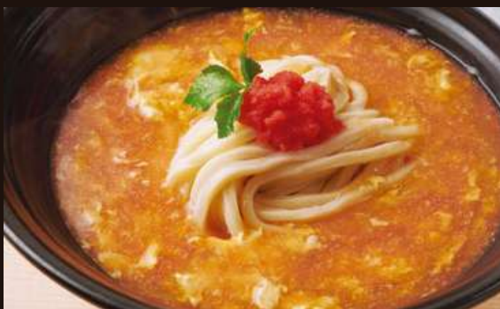
明太餡かけ玉子とじのおうどん Udon with Starchy Sauce, Mentaiko, Scrambled Egg