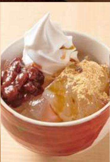
わらび餅パフェ 黒蜜きな粉

Warabi Mochi Parfait with Milk Soft-serve, Adzuki bean, Strawberry Sauce